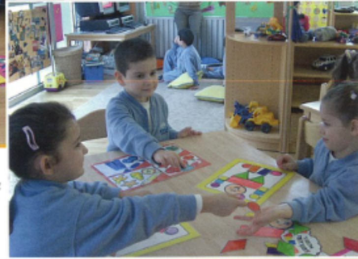
Matematik ve biz