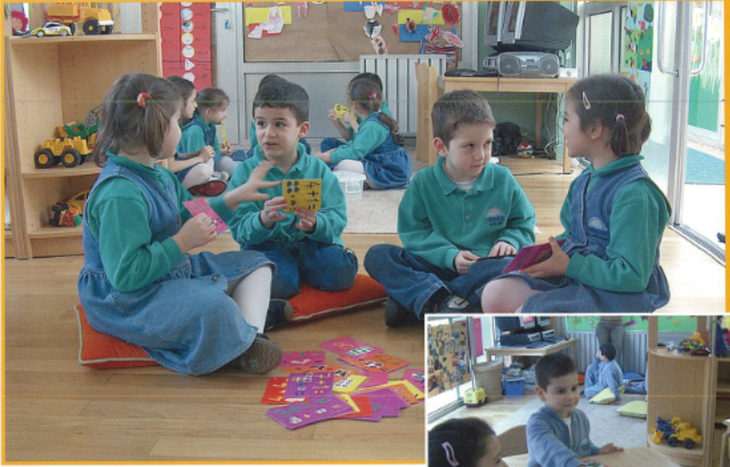
Zevkli bir yıl geçirdik