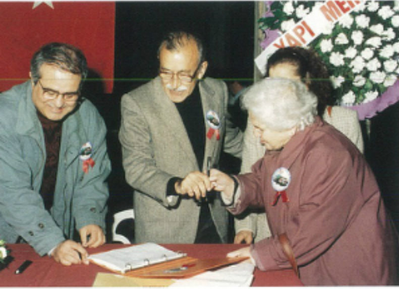
Kuruluş Töreni 23 Nisan 1994